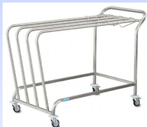
Carrello da trasporto e distribuzione fogli da confezionamento