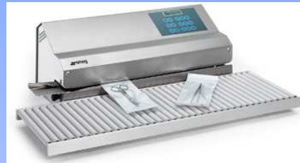
Termosaldatrici rotative (vari modelli)

Dispositivi di controllo e validazione del processo di saldatura