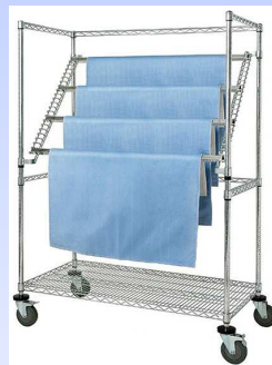
Carrello da trasporto e distribuzione fogli da confezionamento