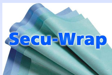
Teli per confezionamento SECU WRAP (SMMS):