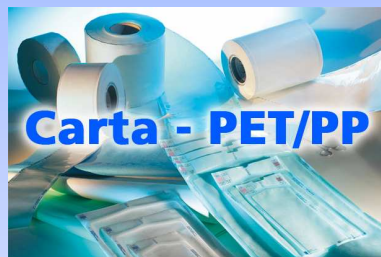
Buste e rotoli in accoppiato Carta - PET/PP

Buste, rotoli, TNT da confezionamento, termosaldatrici e accessori vari.