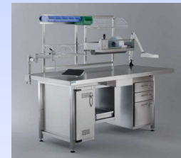
Tavoli attrezzati per il confezionamento