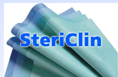
Teli per confezionamento SteriClin: