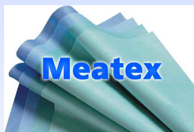
Teli per confezionamento MEATEX (SMMMS):