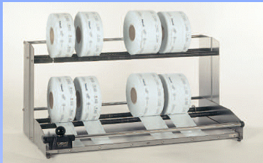
Portarotoli con taglierina