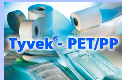
Buste e rotoli in accoppiato Tyvek - PET/PP