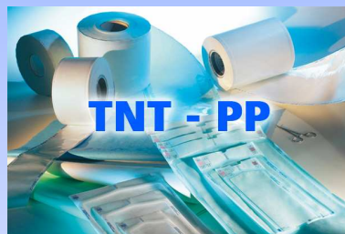
Buste e rotoli in accoppiato TNT - PP