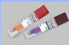
Indicatori Biologici in fiale