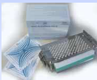
BAG AutoCheck - KIT