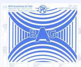
BAG AutoCheck Foglio test