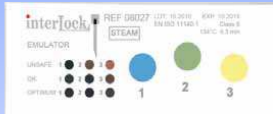
INTERLOCK Indicatore sequenziale 3 fasi