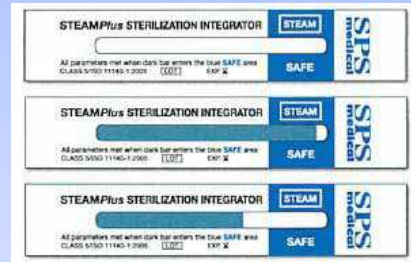
SPS STEAM Plus