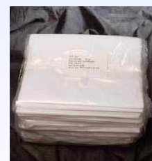
Pacco Test B&D