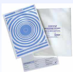
ISP B&D test sheet Foglio test