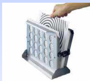
Interlock Pacco Test