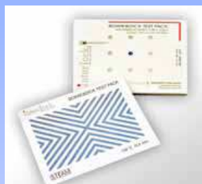
Bowie & Dick Interlock (D)