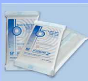
ISP Bowie & Dick Autoclave Test (NL)