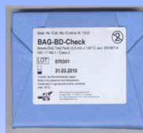
BAG - BD Test (D)