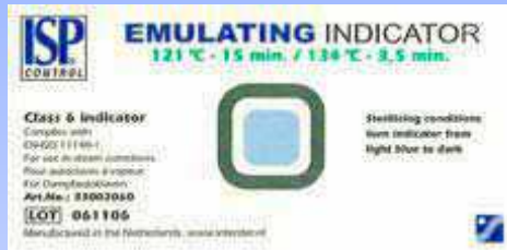
ISP Steam Emulating Indicator Card

Indicatori Chimici a viraggio di colore - VAPORE Cicli di sterilizzazione a Vapore EN ISO 11140-1 Classe 6